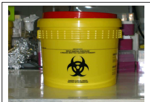
Contenitore rigido per la raccolta di rifiuti taglienti