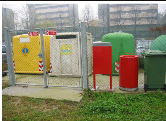
Isola Ecologica Polo via Aselli/Taramelli