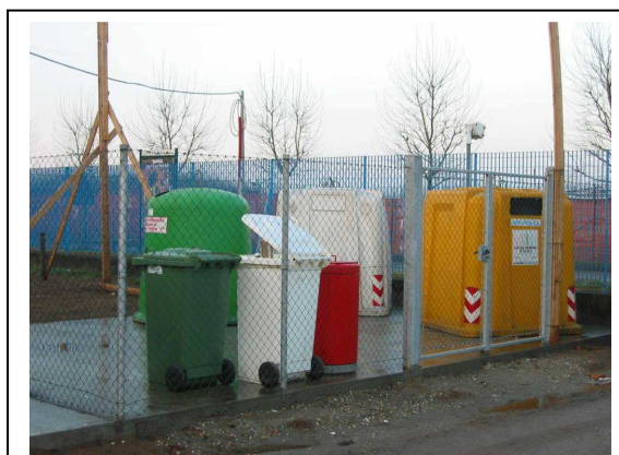
Isola Ecologica Polo Via Ferrara