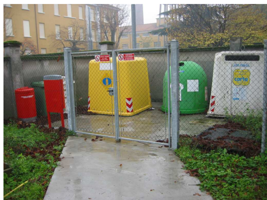
Isola Ecologica Polo Via Forlanini

Ciascuna isola dispone di contenitori per la raccolta differenziata di CARTA, CARTONE, VETRO/LATTINE, PLASTICA, TONER, NEON e COMPONENTI ELETTRONICI, PILE ESAUSTE, FARMACI SCADUTI.